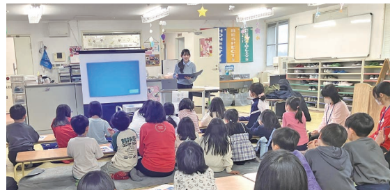
▲東日本大震災・原発事故の話聞く学童クラブの子どもたち

でもある」と話し、まず自分たちが防災について意識を高めていきたいと思います」と語った。