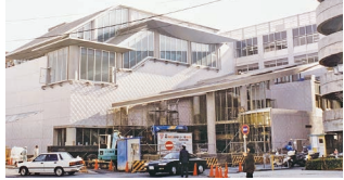
▲建設中の湘南とつかYMCA(同紙1994年1月号掲載)

横浜YMCA最初の地域センターとして、1972年に戸塚区のスーパーマーケット(戸塚駅西口)の一角に戸塚センターが開設されました。人口が増え続けていた当時の戸塚区では、開設して間もなく200人ほどの子どもの登録がありました。1978年には戸塚区役所前のビルへ移転し、体育遊びや小学生英語、中学生の学習指導などのプログラムを実施しました。さらに1987年には、中・高校生の進学指導へのニーズの高まりを受け、より広い施設が必要であること、戸塚駅東口は開発が進み人口増加が始まっていること、複数路線の利用ができ便利であることなどから、戸塚駅東口のビル2階へ移転し、名称を「YMCA戸塚ステーション」と改めました。多目的ホールや研修室を備え、衛星放送の受信、パソコンコーナーの設置によるCAI(個人個別学習)ソフトの導入など注目を集める施設となりました。新たに始めた成人の英会話や従来のサッカー、野外活動クラブ、アフタースクール、小学生英語クラブなどが展開されました。その後、横浜YMCA創立110周年を迎えた1994年に、現在の湘南とつかYMCAに移転し、地域に根差した活動を展開しています。