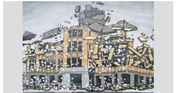
▲原爆投下 爆風による被害

「今、世界中には、当時より格段に威力を増した1万2千発余の核兵器があります。核のボタンを押すようなことは絶対にあってははいけません。核兵器を禁止、廃絶しましょう。戦争を