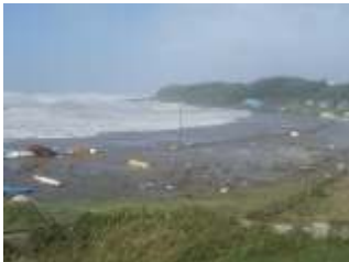
台風により荒れた和田長浜海岸

そんな秋の海でのおすすめの活動に、ビーチコーミング(海岸・砂浜に打ち上げられる漂着物観察)や海岸ハイキングがあります。特に台風が過ぎ去った後などは、海岸に色々な物が大量に打ち上げられます。打ち上げられた物を集め、分類してみてもどうでしょう?これまで見たことのない様な物を発見することが出来るかもしれません。また、和田長浜海岸～荒崎方面にかけて、海岸ハイキングに最適なコースがあります。海岸から見える景色を楽しみながら、夏と一味違った海での活動を楽しんでみてはどうでしょう?