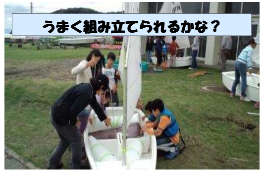
うまく組み立てられるかな？

9月25日（土）、マリンクラブ第9回目の活動を行いました。この日は天候がよければ、ヨット（OP）で海に出る予定でしたが、前日から台風が三浦半島にも接近・・・長浜海岸は希に見る強い波が立っていたため、海へ出ることは中止しました。その代わりとして、午前中はヨットの艀装を練習しました。普段グループでヨットの艀装を行うと、艀装が得意なメンバーと苦手なメンバーもいますが、ヨットをやるからには、ひとりでも艀装できるようになりたいです。すよね☆そこで、みんながヨットの組み立てが分かるように、じっくりと何度も繰り返し行いました。艀装のポイントは、シート（ロープ）を正しい順番でブロック（滑車）に通すことと、舳（もやい）結び。これらができなければ、海へ出ることは出来ません。メンバー達は、今まで練習したロープワークやヨット体験を思い出し、みんなで話し合いながら艀装に挑戦していました。ひとりひとりが練習を終えた後は、「艀装レース」を行いました☆このレースは、遠くにあるライフジャケットを走って取りに行き、正しく着用してから艀装に取りかかり、完成までの順位を競いました。みんな走りも艀装も頑張りましたね☆午後には台風も去り、晴れてきたので、ビーチクリーンを行いました。今回はただゴミを拾うのではなく、最初に配られた「わらし一本を、海岸に落ちている宝物と交換していく「わらしべ長者ゲーム」を楽しみながら行いました☆いつもとは違う海の様子を見ながら、みんなでゴミを一生懸命拾うことができました♪