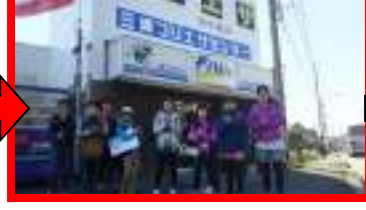
【つりエサセンター】