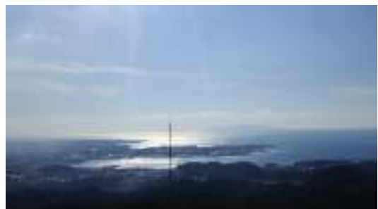
【大楠山展望台からの絶景】