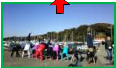
【小網代湾で逆立ち】