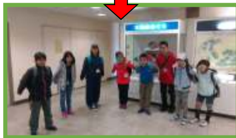
【三崎魚市場でまぐろポーズ】