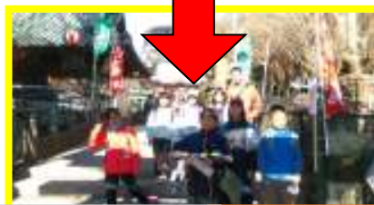
【海南神社に無事到着！】