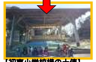
【初声小学校横の土俵】