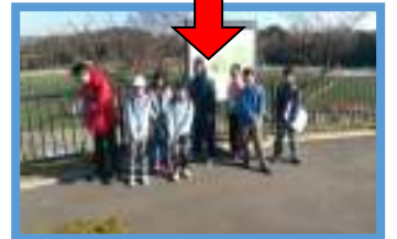
【三浦スポーツ公園】