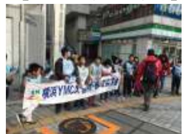
【街頭募金も頑張りました☆】