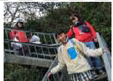
【どんどん進みます!】