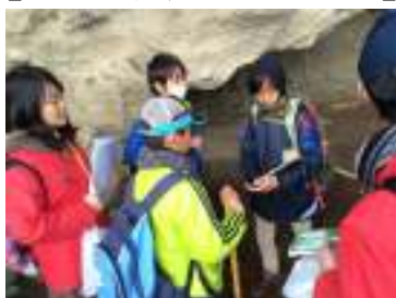
【みんなで協力して回答探し!】