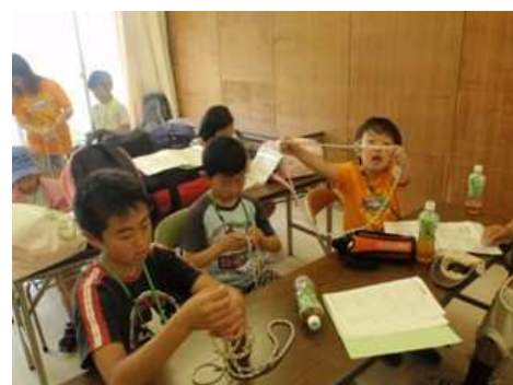
OPヨットで海に突撃!!